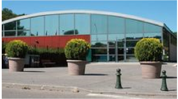
Le gymnase Emilie Fer Un parking gratuit se trouve derrière la structure

Coordonnées GPS : Latitude 7.09833333 Longitude 43.68500000